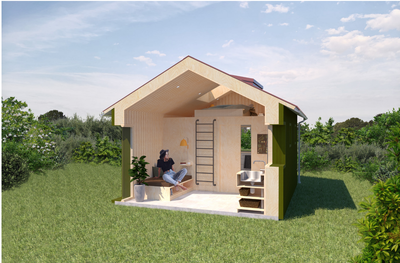
Fotomontage med sektion