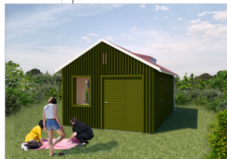
Fasad med huvudentré