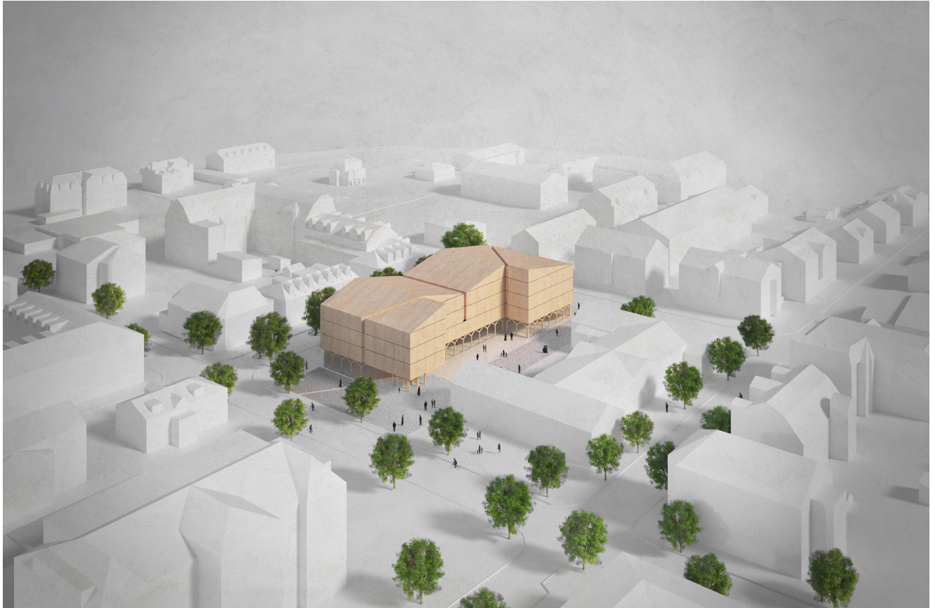
Vy från sydost med aktuellt huvudalternativ