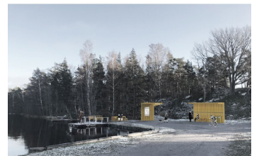
Gränsö udde entré