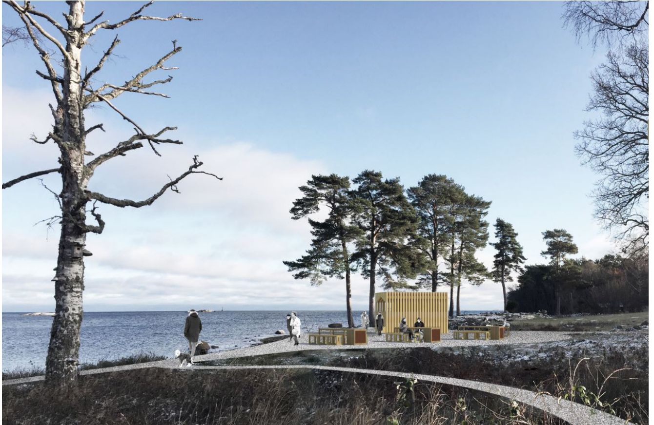
Perspektiv över mötesplatsen Kroken