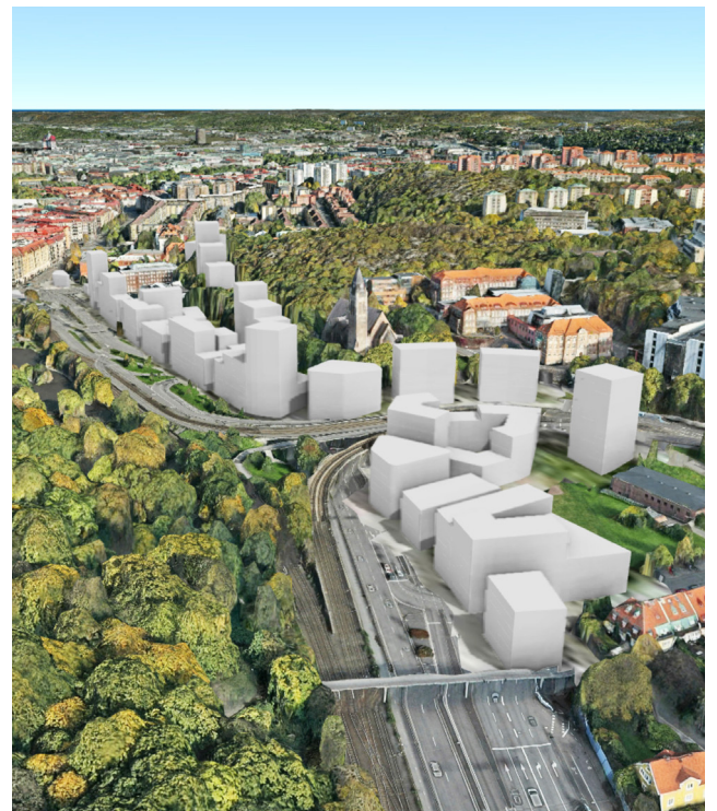
Stadsbildsstudie i Cityplanner på samma delsträcka.