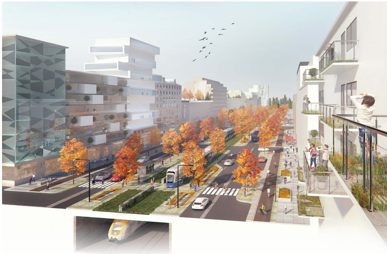
Idéperspektiv över boulevarden sett från söder mellan Marconimotet och Flatåsmotet.