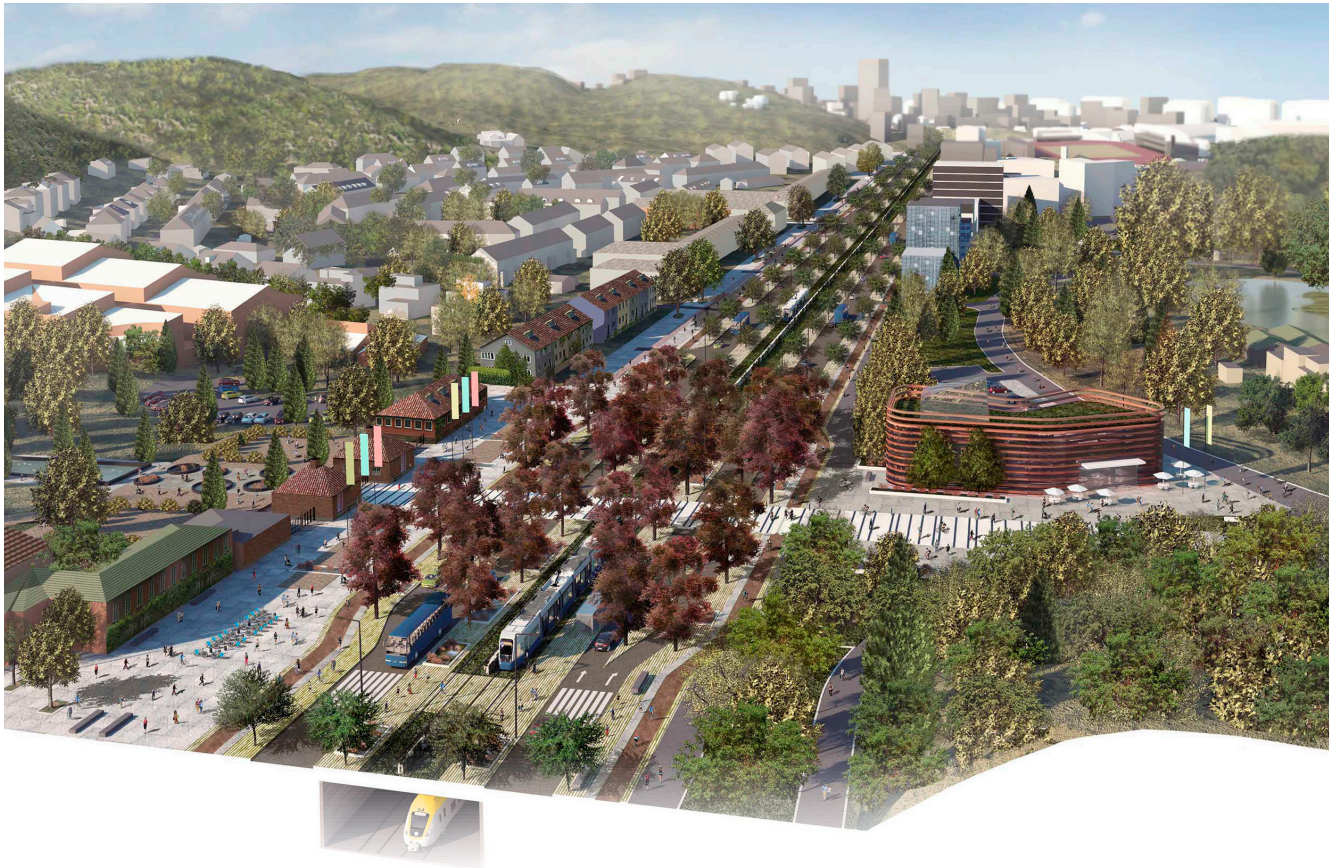
Perspektiv mot söder över entréen till Botaniska trädgården som visar en ny möjlig hållplats respektiv koppling och entré mot Slottsskogen.