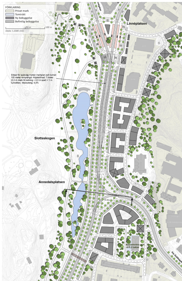
Utsnitt ur framtagna situationsplan för sträckan mellan Linnéplatsen och Per Dubbsgatan.