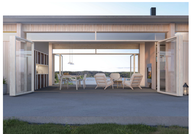
Fotomontage av föreslagen bebyggelse

Claudia Lozano Altenius var huvudansvarig arkitekt för uppdraget och bistods av Johan Altenius som ansvarig för yttre miljö och disposition.