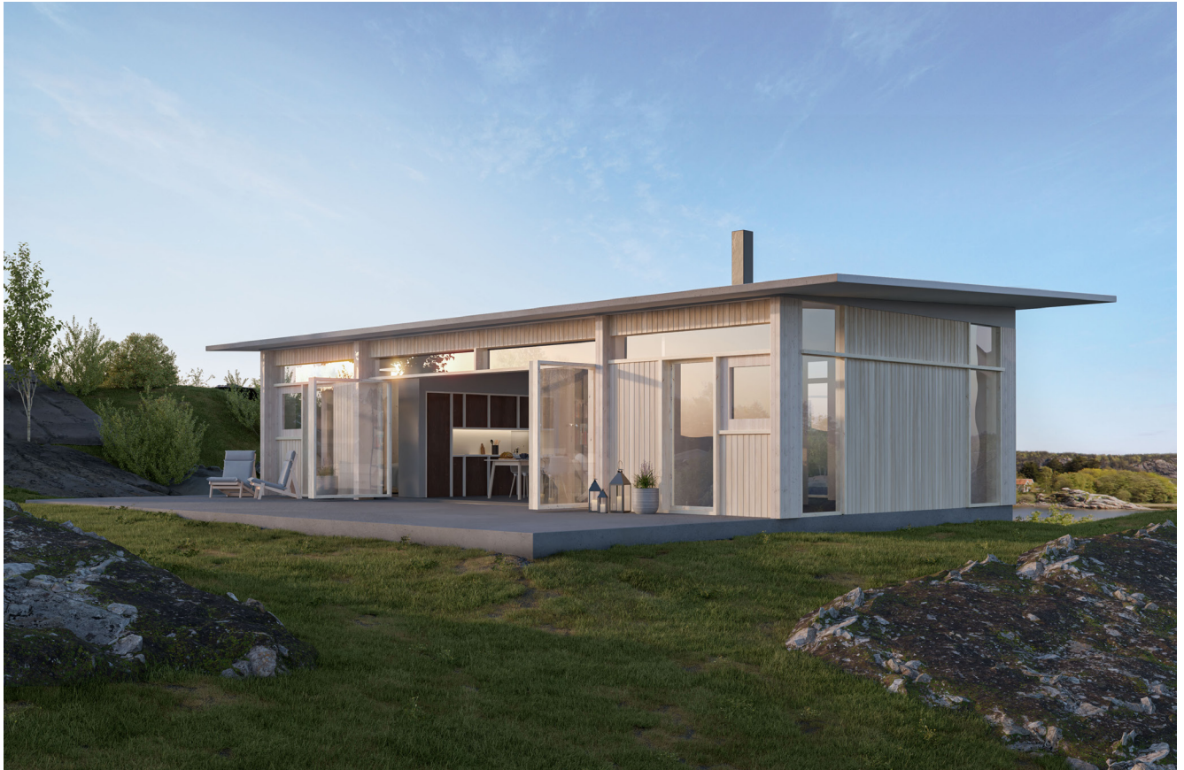
Fotomontage som visar föreslagen bebyggelse på platsen i Henån